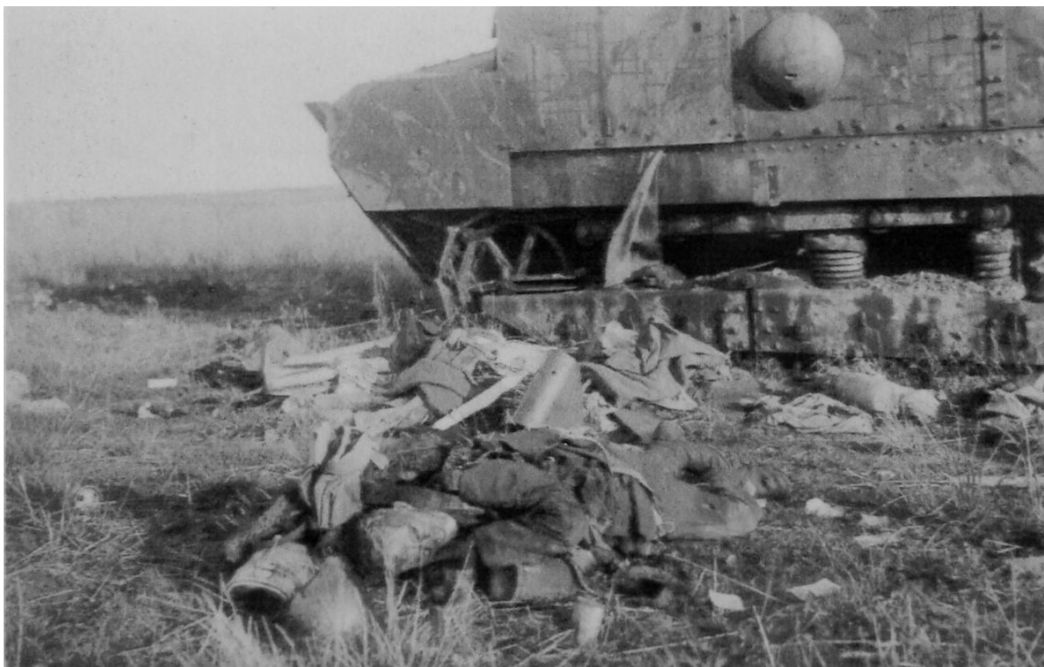
Een tussen de dorpen Méry en Belloy vernietigde Schneider tank met een omgekomen bemanningslid, vermoedelijk van de A.S. groep nr. 1.