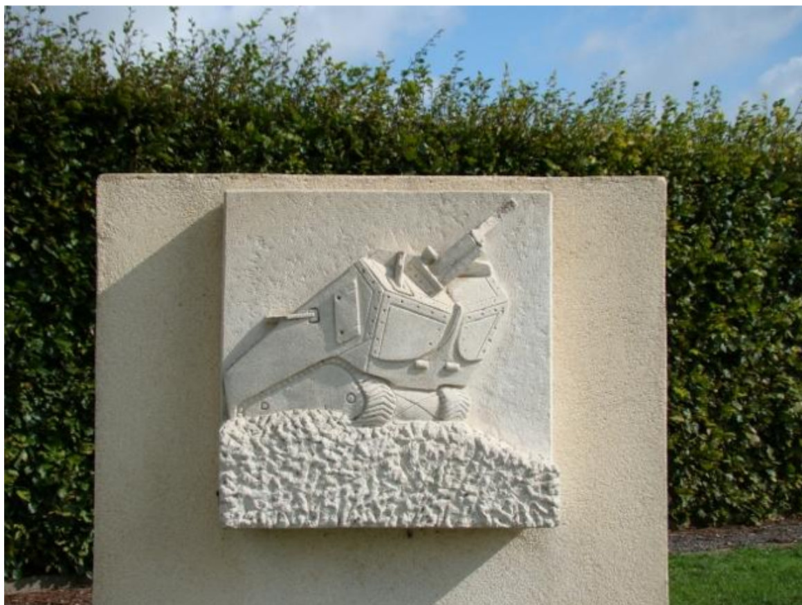
Het bovenste gedeelte van het monument 'Aux combattants de l'Artillerie Spéciale dans les combats de 1918'. De loop van de afgebeelde Saint Chamond tank is afgebroken.

Soms neemt de verering van de Franse tanks bijna religieuze vormen aan. Zo staat in het dorp Belloy een monument waarop een stuk verroest metaal van een tank als een heilig relikwie is aangebracht. De foto's op de informatieborden langs de route 'Juin 1918 - Mémoire des chars' laten echter ook zien dat het bestaan van een tankbemanning in die rijdende doodskisten bepaald niet glorieus was. Men had weinig kans als een tank werd geraakt door bijvoorbeeld een Duitse 77 mm artilleriegranaat. De 28-jarige luitenant Prosper Marchand van het 500 e of 501 e R.A.S. was daar één van. Hij ligt onder nummer 813 op de begraafplaats van Méry-la-Bataille [7].