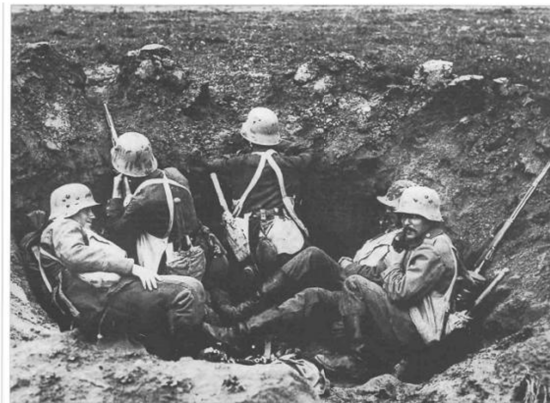
Een groepje Duitse stormtroepers omgord met zakken met handgranaten.

groepjes elitesoldaten omhangen met zakken vol met handgranaten. Achter de stormtroepen volgden de infanteristen van de tien ingezette divisies van het Duitse Achttiende Leger. Het gehele scala van aanvalswapens werd ingezet: vlammenwerpers, mijnenwerpers en zelfs een paar van de zeldzame A7V tanks. De Duitsers volgden de vallei van de rivier de Matz en rukten op richting de Aronde, een tweede zijrivier van de Oise.