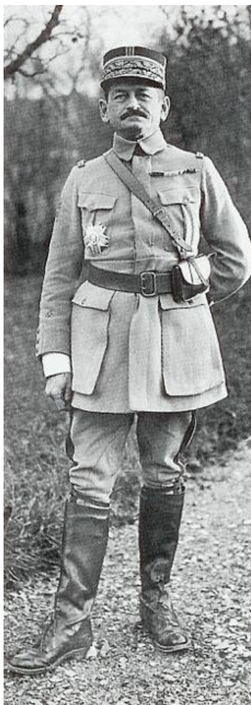
Generaal Charles Mangin.