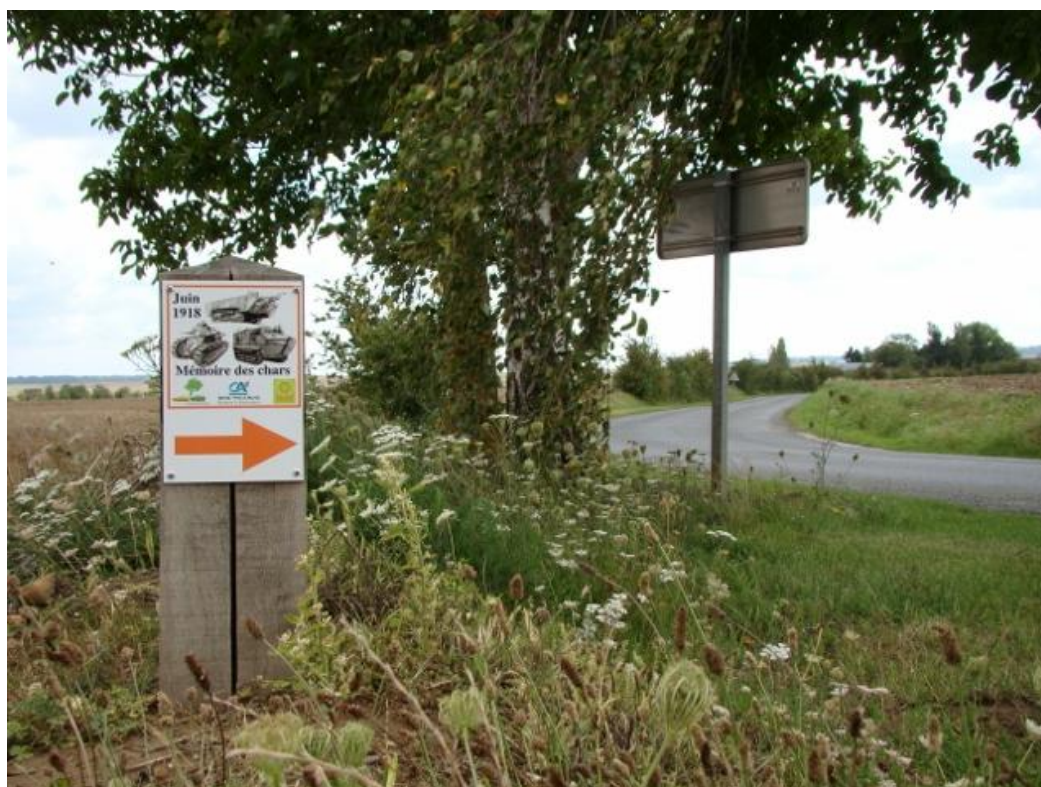
De Rue d'Enfer in het dorp Courcelles, onderdeel van de route 'Juin 1918 - Mémoire des chars'.

De grote Duitse voorjaarsoffensieven reikten in juni 1918 tot het kleine dorp Courcelles-Epayelles [1], gelegen op een vlakte tussen de plaatsen Montdidier en Compiègne. Het dorp bestaat uit slechts een paar huizen en een kerk maar een weg rondom het dorp heeft in de Eerste Wereldoorlog geschiedenis gemaakt. Op de Rue d'Enfer werden op 11 juni 1918 drie alom bekende foto's genomen van een Frans bataljon dat dekking zocht in het talud van de weg. Beklemmende en gruwelijke iconen van de strijd in dit gebied, die het hoogtepunt vormde van een op 9 juni 1918 begonnen Duitse aanval richting Compiègne. Mede door de inzet van Franse tanks werd die aanval door de Fransen gepareerd. Waarbij een hoofdrol was weggelegd voor generaal Charles Mangin. De Fransen verwijzen naar de strijd als 'La bataille du Matz', genoemd naar een zijrivier van de rivier de Oise. Tastbare herinneringen aan de gevechten waren hier tot 2004 beperkt, maar dankzij de inzet van de Franse tankspecialist Bruno Jurkiewicz zijn er informatieborden en enkele gedenktekens geplaatst [2]. Tevens is er een route 'Juin 1918 - Mémoire des chars' uitgezet zodat de strijd meer aandacht krijgt.